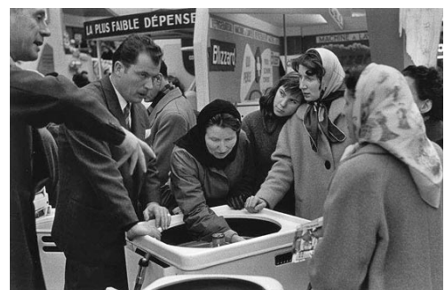
Salon des Arts Ménagers 1956

Parallèlement, la France connaît une situation de quasi-plein-emploi pendant laquelle le taux de chômage est contenu à un niveau compris entre 2% et 3% (contre environ 9,5% en 2005).