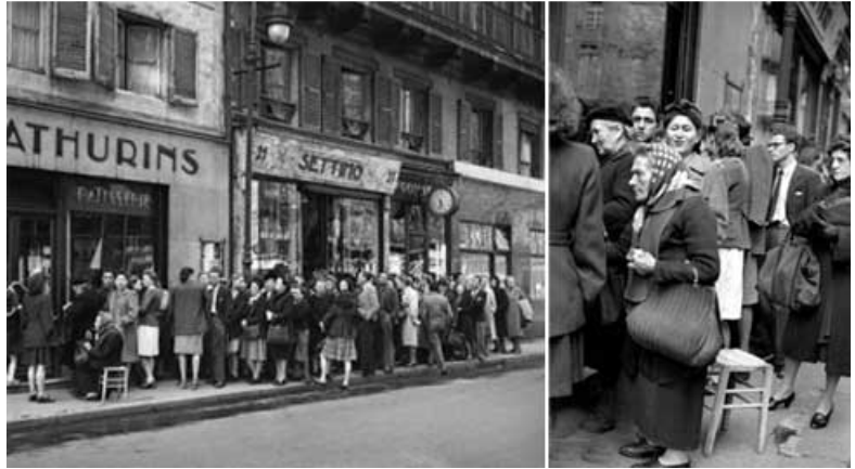
Queue devant une boulangerie en 1947 à Paris

La France ne connaît pas de réelle croissance et la vie est difficile en raison des bas salaires et du coût élevé de la vie.